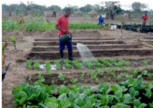
Alcinio vander sine bede

foregangsmænd for udvikling i deres lokalsamfund 3) selvstændigt at træffe fundamentale valg for livet og troen.