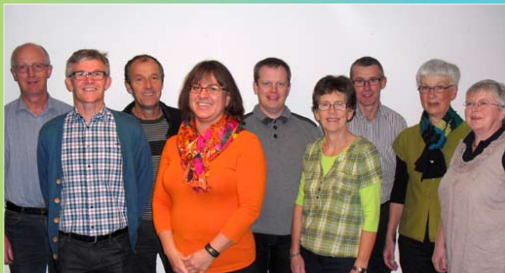
Det nye fælles menighedsråd

NR. 1 DECEMBER 2012 JANUAR - FEBRUAR 2013