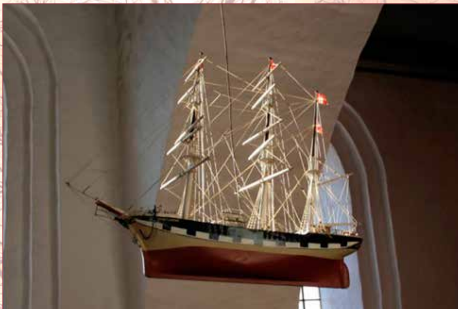
Skibet fra Vorbasse Kirke

NR. 4 DECEMBER 2013 – JANUAR – FEBRUAR 2014