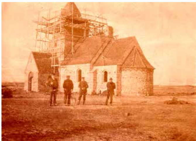
Fra opførelsen af Skjoldbjerg kirke