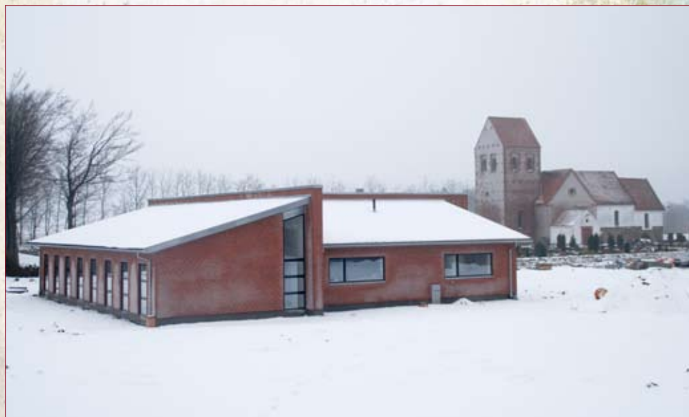
Nyt sognehus i Vorbasse