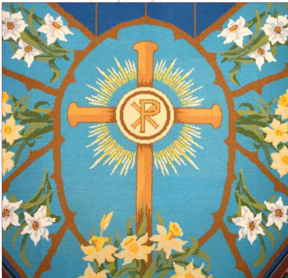
Altartæppe fra Skjoldbjerg kirke