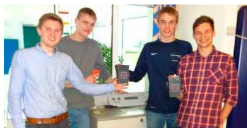
Fire kække indsamlingsfyre

Vi er med i Sogneindsamlingen, fordi det altid er en god og hyggelig dag, hvor vi, på tværs af generationer, deler vores søndag med mennesker, der virkelig har brug for hjælp. Vi hygger os både med turen med indsamlingsbussen og efter indsamlingen i sparekassen med en let frokost.