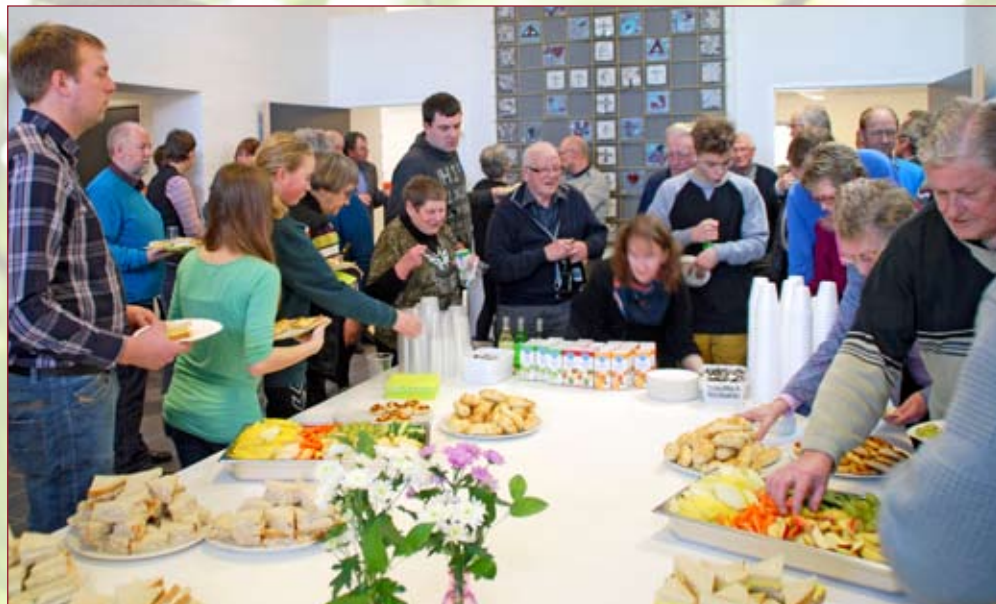
Indvielse af nyt sognehus i Vorbasse