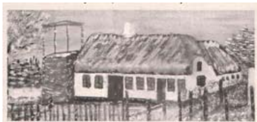
Gl. maleri af Jørgen Nielsen Jørgensens ejendom

Hans kollega skriver i sit brev, at han ikke kan forstå, hvorfor sognerådet har sat ham op. Det fremgår af brevet, at hans indtægt har været den samme som foregående år, nemlig 780 kr, men skatten er steget fra 57 kr til 83 kr. (Stigningen svarer til 46%). Han skriver videre i brevet, at han af skattelisten kan se, at der er flere karle, som har tjent en lignende løn som