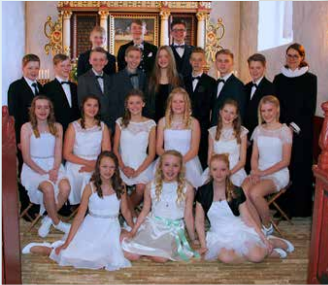
Konfirmation Vorbasse Kirke