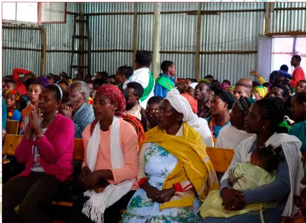
Gudstjeneste i Addis Ababa