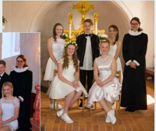
Konfirmation Skjoldbjerg Kirke