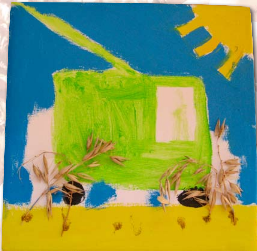
Mejetarsker fra Skjoldbjerg