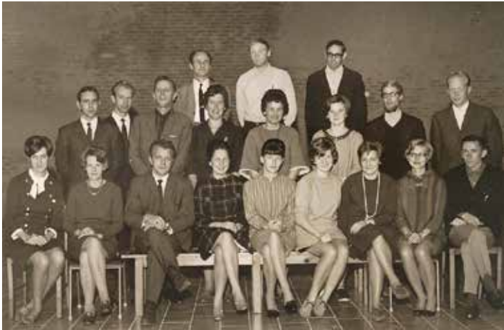
Det sidste "anstændige" lærerbillede før de lange bukser rykkede ind 1968

syet af blåt denimstof og forsynet med kobbernitter og dobbeltsyninger. Bukserne skulle være slidstærke, da de først og fremmest var beregnet til guldgravere og andre mænd med hårdt arbejde. Bukserne blev en succes. Under 2. verdenskrig hørte de med til både den amerikanske hær og flådes normaludrustning, også til de kvinder, der var der.