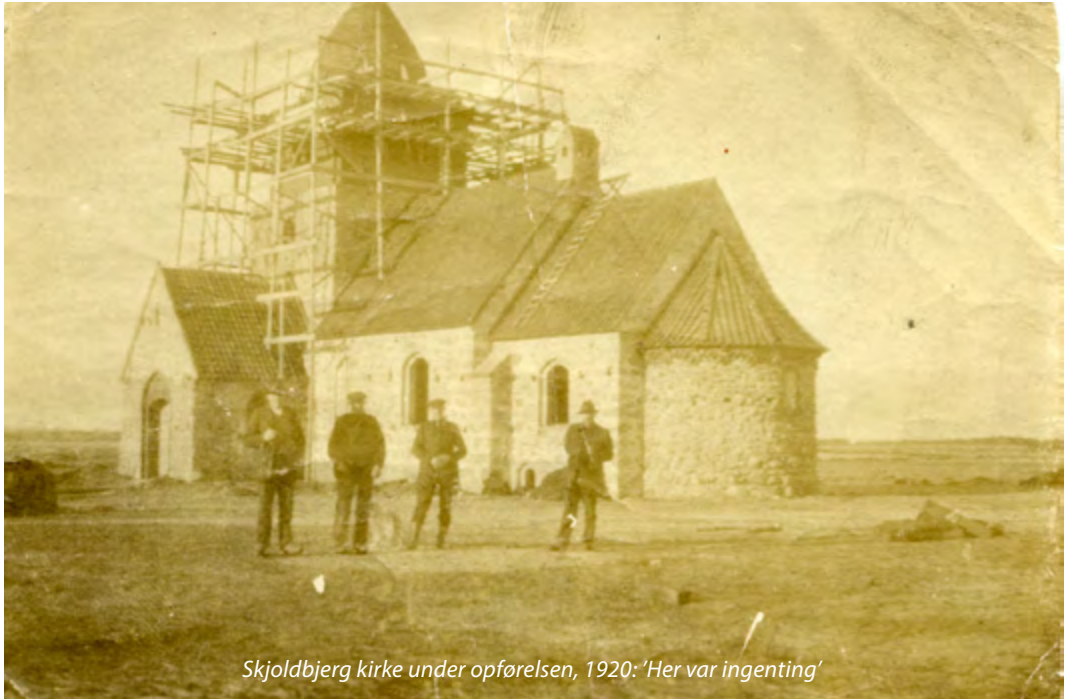
Skjoldbjerg kirke under opførelsen, 1920: 'Her var ingenting'