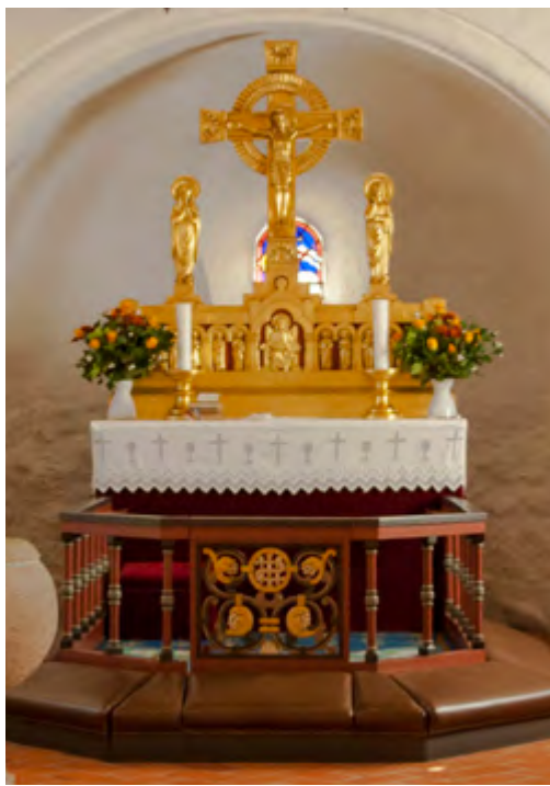
Kirkens gyldne alter, kendt fra mange andre kirker hjemme og i udlandet