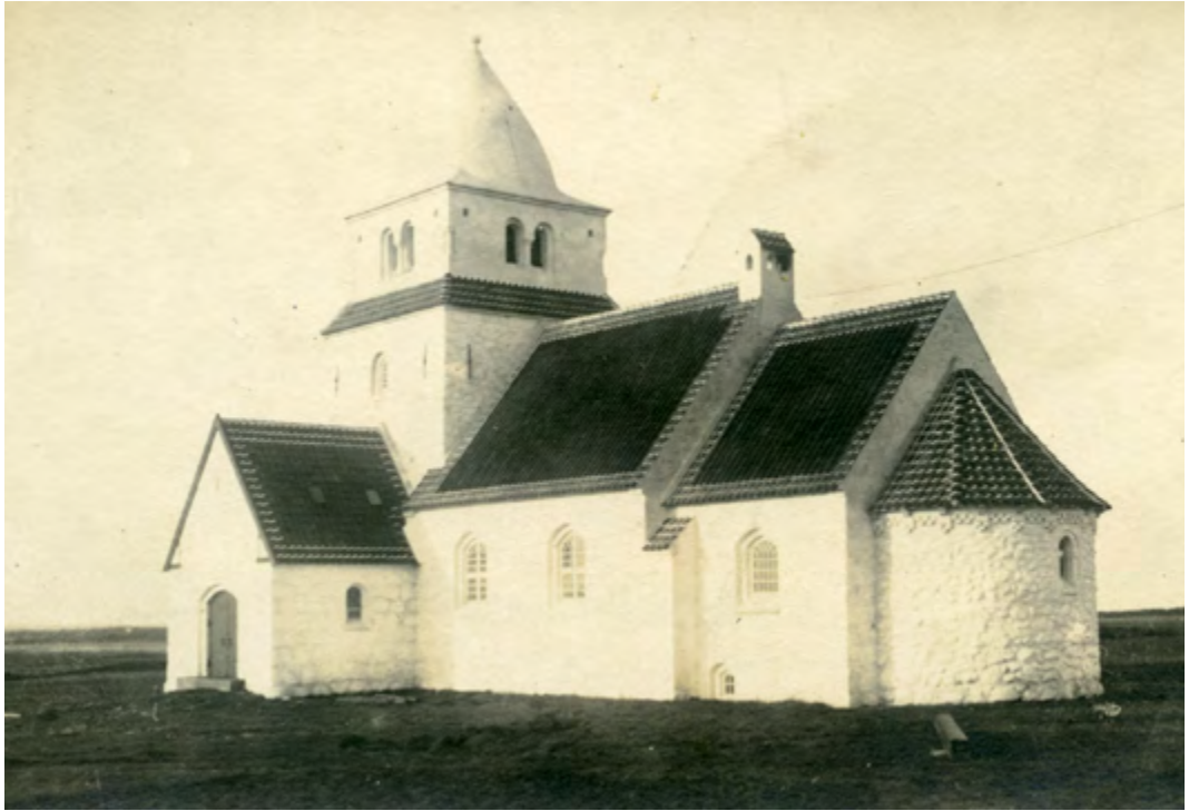
Skjoldbjerg kirke, nybygget, 1921