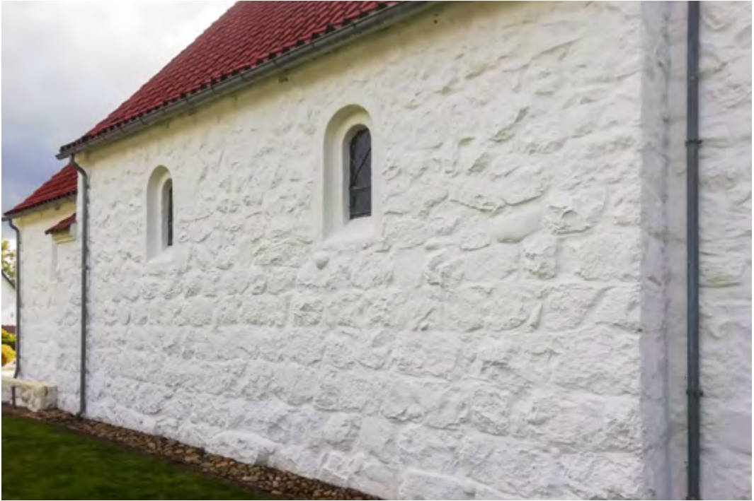
Nordmuren; kun de nederste skifter var murerne godt tilfredse med...